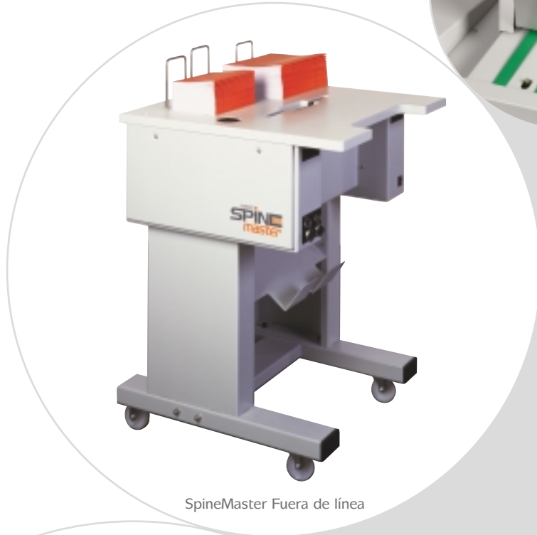
SpineMaster Fuera de línea