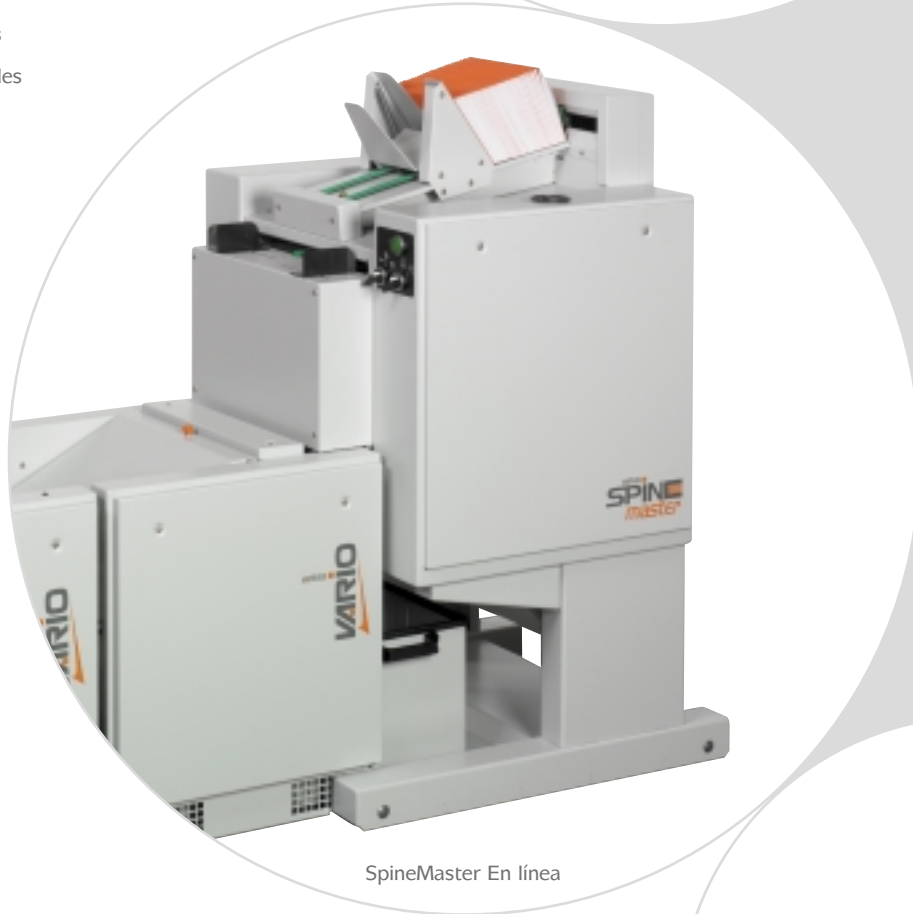
SpineMaster En línea